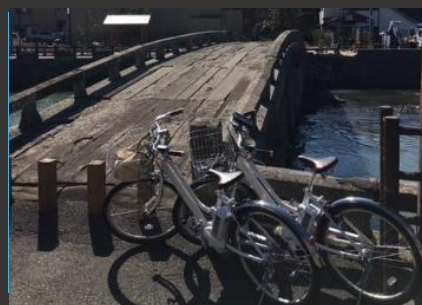
史跡巡りサイクリングコース