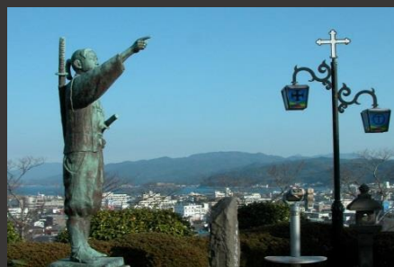
本渡観光サイクリングコース