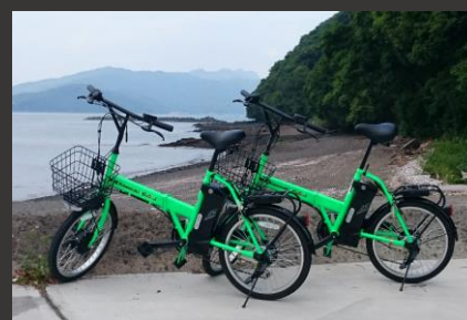
しおかぜサイクリングコース

天草地域雇用創出協議会 熊本県天草市今釜新町3530 https://amakusa-koyou.jp/